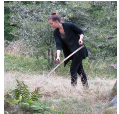
Många vill också lära sig att slå